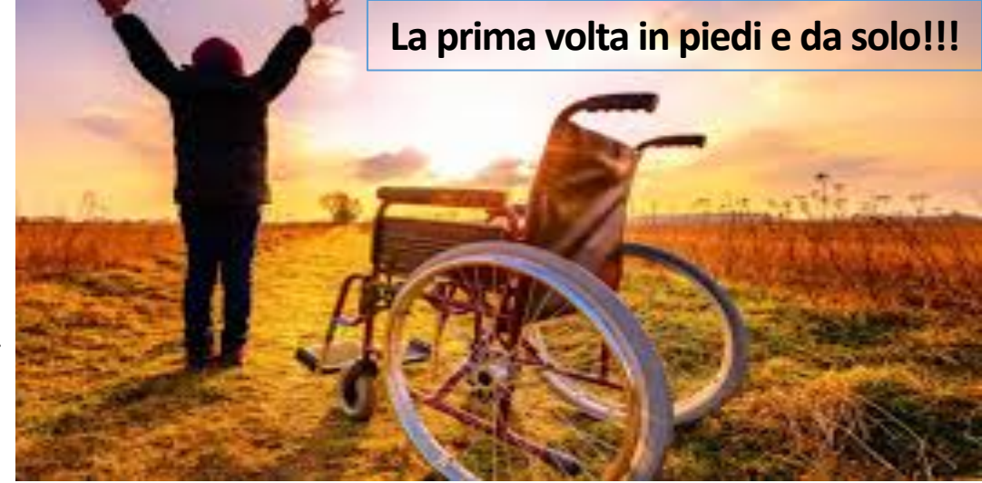
La prima volta in piedi e da solo!!!

L'obiettivo dei Miracoli di Gesù non era dimostrare la potenza di Dio, ma che Gesù fosse Dio: la Bibbia non elenca tutti i miracoli di Gesù → Gv 20.30-31