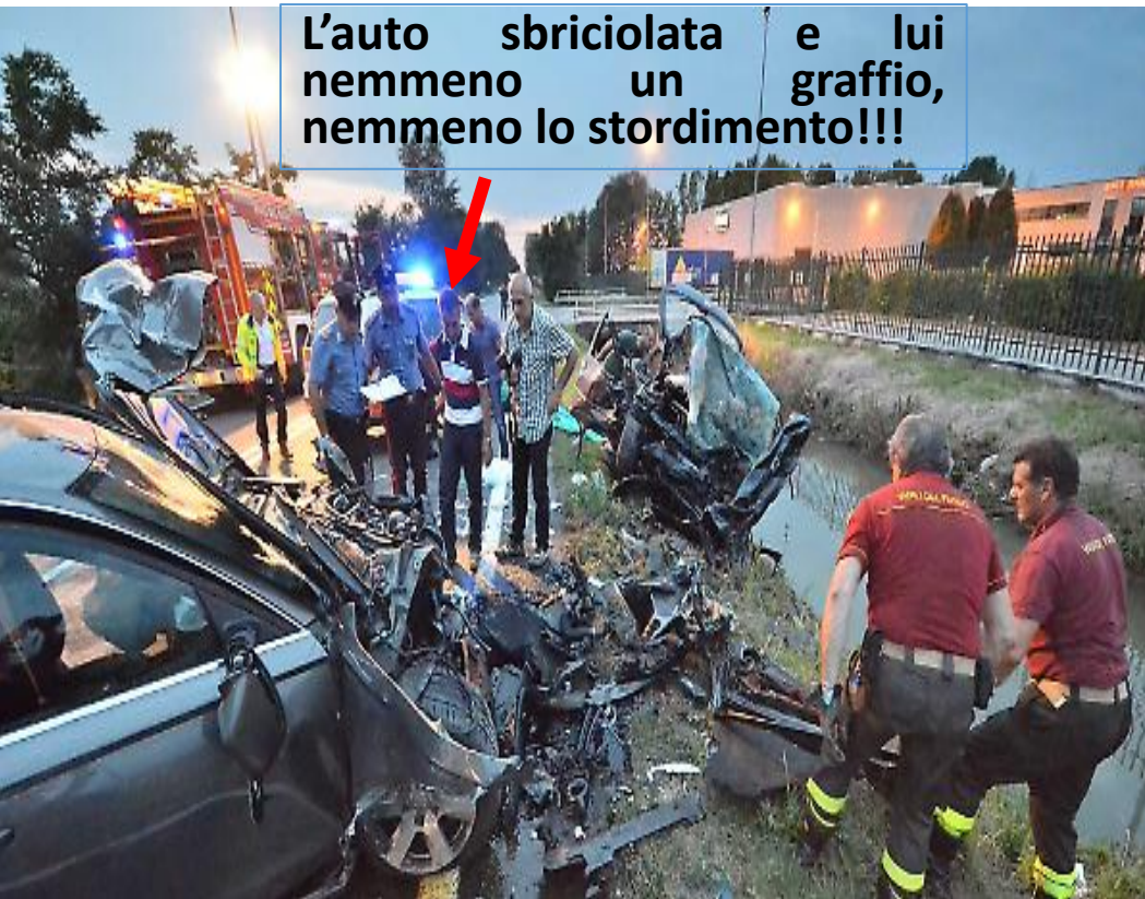
L'auto sbriciolata e lui nemmeno un graffio, nemmeno lo stordimento!!!

Il miracolo VERO può anche essere il verificarsi di una contingenza inaspettata e favorevole, decisiva per modificare il corso degli eventi: ad esempio, fu un miracolo che io mi trovassi lì per trattenerlo... (io con l'auto a Lanciano)